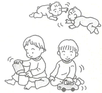
友達は一人数でも十分。いっしょにいるだけでいい時期。