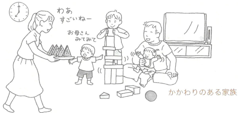
かかわりのある家族