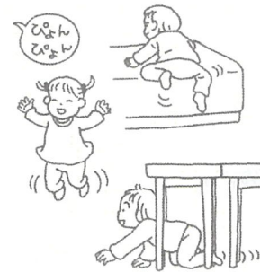
脳に酸素をぐんぐんぐん。