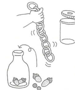
手を使えるものを考えてみよう。