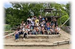
園庭でハイポーズ