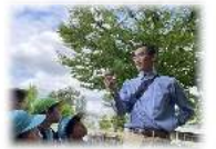
野付牛公園 森探検inみどり

持ち物 そよかぜ あおぞら ～水着 バスタオル 防水バック おひさま ひだまり わたぼうし～なし（園着替えを使用） ※ 使用した日は持ちかえり、洗って翌日お持ちください。