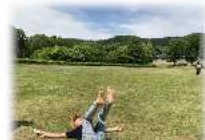
足の裏で 太陽の光を 感じよう ～フィールド ピョンピョン～